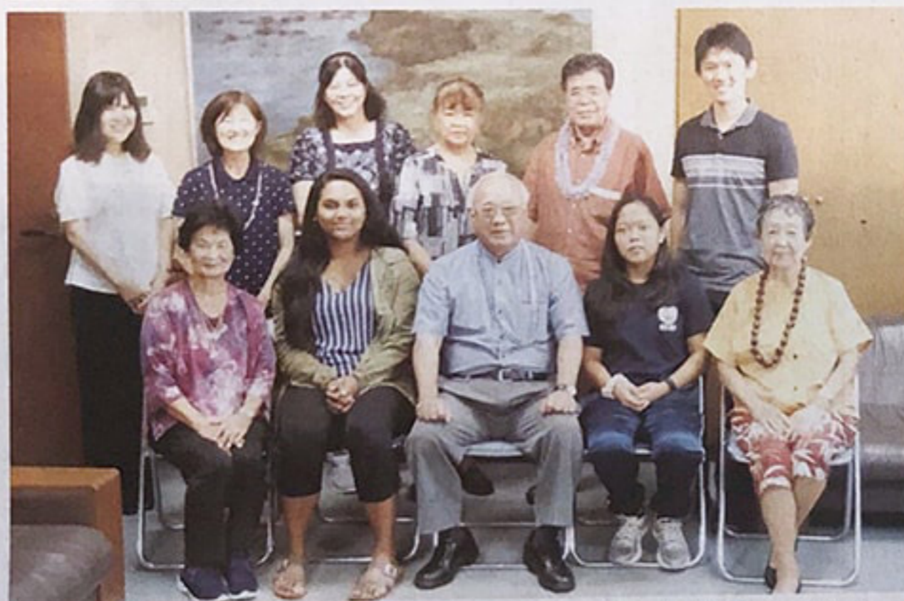
下地市長（前列中央）と一緒に記念撮影するケイラさん（同左から2人目）と、クインシンさん（同右から2人目）=18日、市役所平良庁舎

「2019年宮古島・マウイ島スクール体験相互交流事業」で来島した生徒らが18日、市役所平良庁舎に下地敏彦市長を表敬訪問した。ホストファミリー宅で